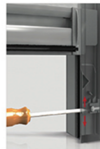
Dispositif « Clic-Clac » de série

Le profil de la barre de charge, rigide et ergonomique , permet une prise en main facile sans poignée plastique encombrante et fragile. Le dispositif breveté « Clic-Clac » monté de série assure un verrouillage et un déverrouillage intuitif de la toile en position basse. Intégré dans la coulisse, il est discret et bien protégé. Un large joint brosse, positionné en frontal ou en position basse, assure une parfaite étanchéité de la moustiquaire avec le rebord de fenêtre.